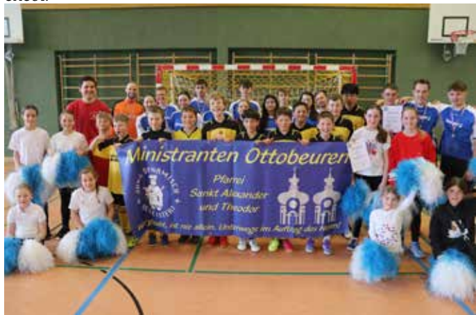
Die Ottobeurer Spielerinnen und Spieler, Fans und Cheerleader mit ihrem Banner.

Das Turnier bot eine gute Gelegenheit zum Austausch und Kennenlernen und wurde von allen Beteiligten als fair und gelungen erlebt.