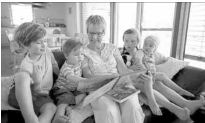
Familienpaten unterstützen Familien mit kleinen Kindern.